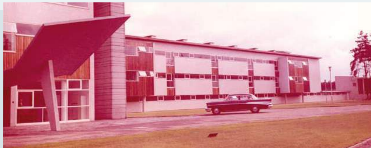
↑ Sint-Barbarakliniek, Lanaken