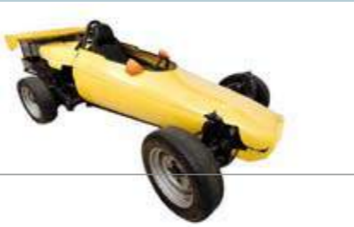
↓ Gele oefenwagen, ca. 1968 Circuit Zolder