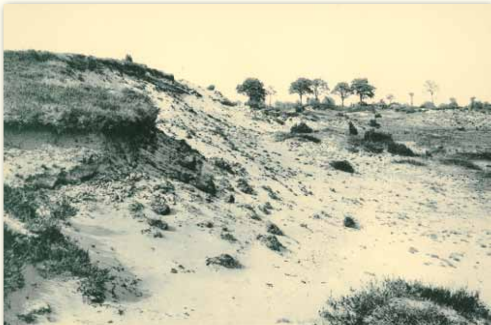
De arme gandgrond van de Limbuge Kempen (Winterstag – Genk)