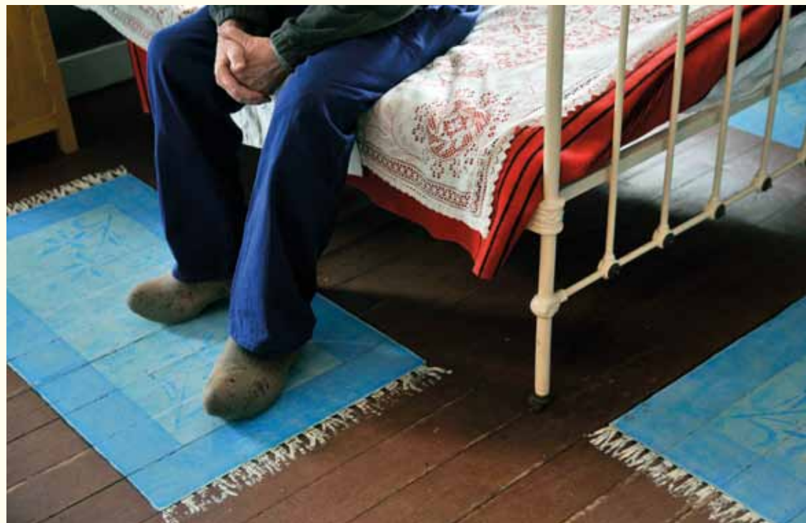
Museum van de Mijnwerkerswoning in Eisden.

Gedeeltelijk toegankelijk voor mindervaliden.